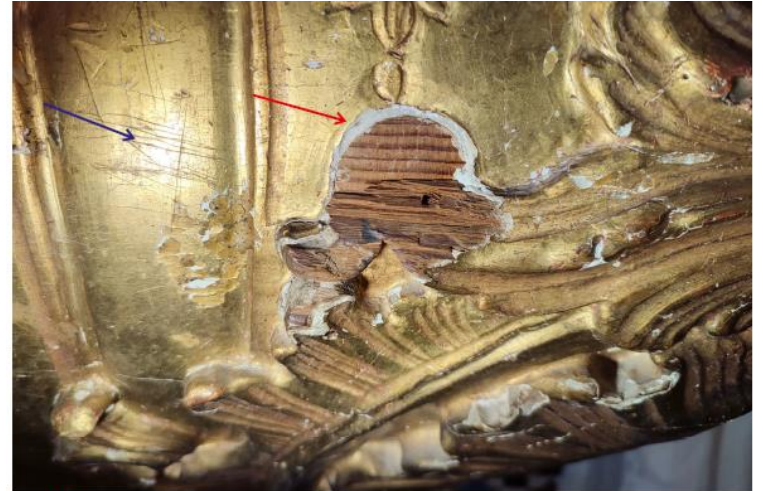
Fig 24. (A) Pérdidas de piezas de madera por rotura. (B) El banco presenta zonas arañadas.