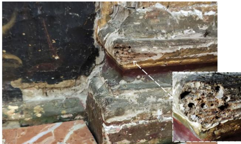
Fig 29. Podemos observar la zona más debilitada del retablo y que presenta un mayor ataque de insectos xilófagos.